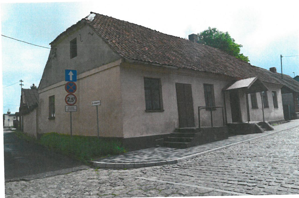
Fot. Dom mieszkalny z początków XIX w., ul. Zamkowa 39