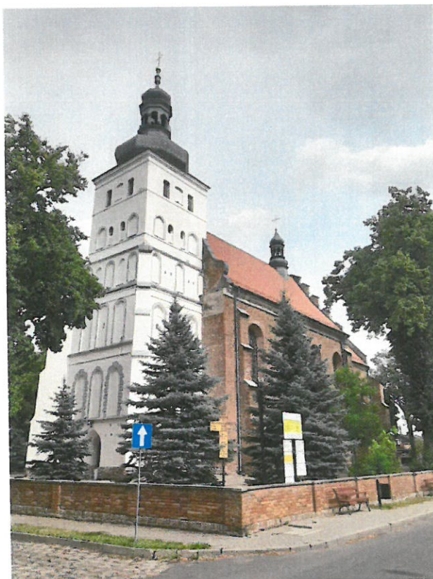
Fot. Kościół parafialny pw. Wszystkich Świętych i św. Hieronima.

znajdują się także zbiory bibliofilskie – 257 pozycji z okresu XVI do XIX wieku, oprócz tego księga mszalna z XVIII wieku, miecz z XIII wieku, rzeźby, dokumenty a nawet hełm tatarski z XVIII wieku.