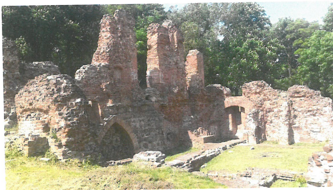
Fot. Ruiny zamku biskupiego