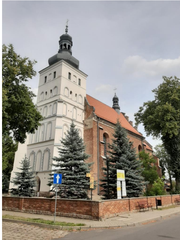
Fot. Kościół parafialny pw. Wszystkich Świętych i św. Hieronima.

znajdują się także zbiory bibliofilskie – 257 pozycji z okresu XVI do XIX wieku, oprócz tego księga mszalna z XVIII wieku, miecz z XIII wieku, rzeźby, dokumenty a nawet hełm tatarski z XVIII wieku.