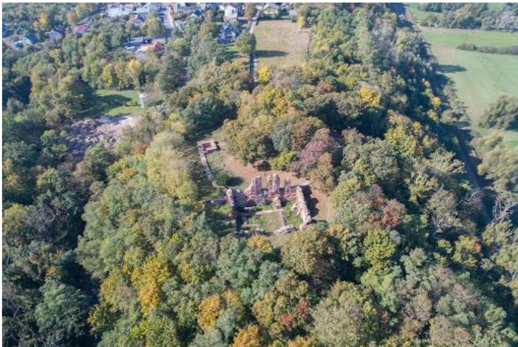
Fot. Grodzisko z okresu średniowiecza