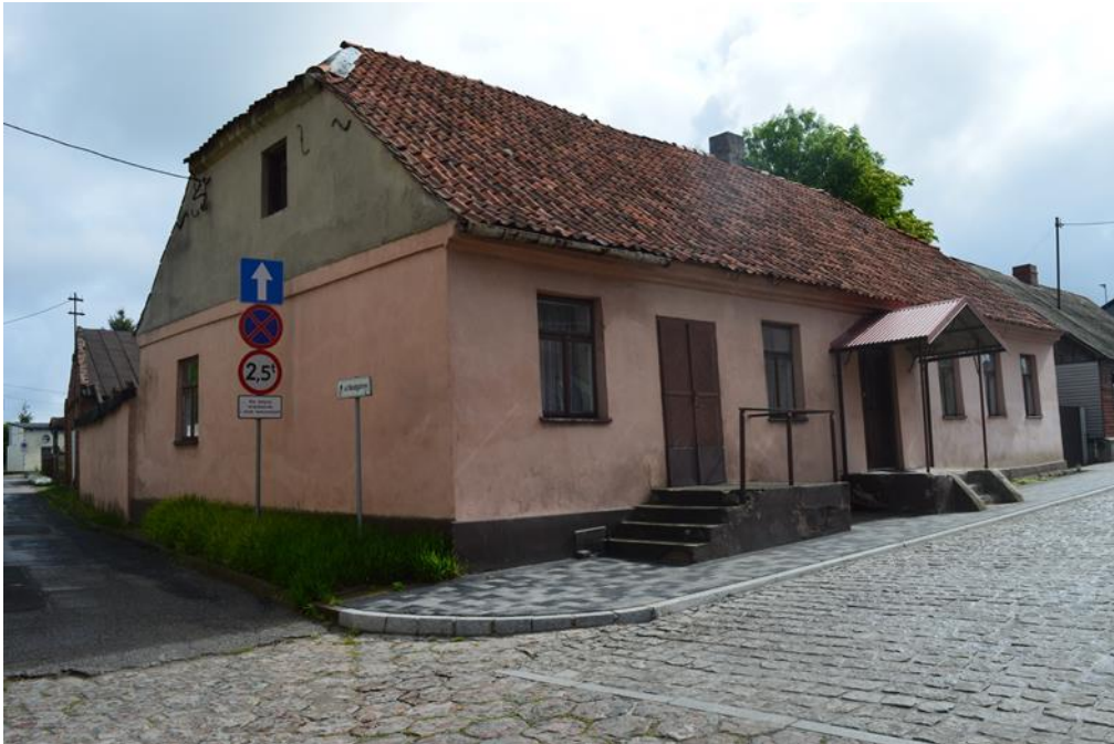
Fot. Dom mieszkalny z początków XIX w., ul. Zamkowa 39