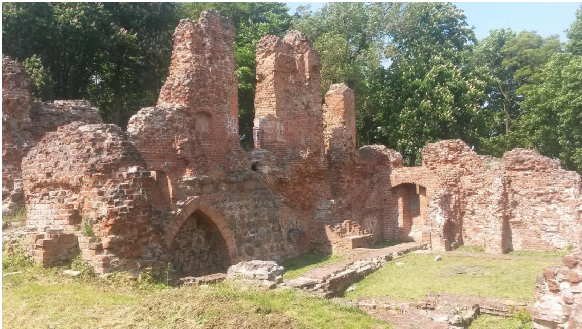
Fot. Ruiny zamku biskupiego